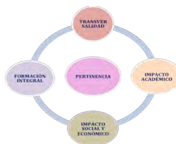
Figura 1. Ejes de desarrollo de la vinculación universitaria

La vinculación debe ser considerada como una actividad estratégica para lograr la excelencia en una institución de educación superior a través de programas integrales implementados en convenio con los sectores social y productivo, para ello: “Deberá impulsar formas de organización que aseguren la participación y cooperación coordinada de los centros, escuelas y facultades de las Instituciones de Educación Superior (IES), en atención a demandas sociales identificadas mediante la integración de una oferta pertinente de servicios, proyectos y capacidades” (ANUIES, 2009, p. 5).