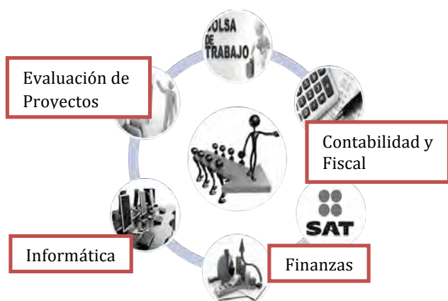
Figura 3. Áreas de servicio que integran el CACE

En el contrato que se celebre entre usuario y el CACE se especificarán cláusulas relativas a los compromisos establecidos para ambas partes, honorarios y acuerdos en relación a inicio y fin del servicio. En el reglamento de este centro también se contemplan sanciones que van desde la amonestación hasta la expulsión, dependiendo de la gravedad de la falta y omisión, todo esto con fundamento en la Ley Número 4 Orgánica de la Universidad de Sonora. Los servicios que se ofrecen en este centro se aprecian en la figura 3: