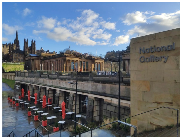
Imagen 12. Perspectiva National Gallery of Scotland, Edimburgo.

El adecuado desarrollo de la función didáctica, amparada bajo la óptica mercadotécnica, conlleva, en conclusión, un aumento exponencial tanto de los visitantes como de la financiación. Dicha realidad genera beneficios ingentes, en el amplio sentido de la palabra, sin restar valor social o deontológico a una institución que, sin ánimo de lucro, como en los casos analizados, está al servicio de la sociedad. Los museos escoceses, como espacios culturales, democratizadores y educativos, se valen magistralmente del marketing estratégico para lograr la consecución de sus fines y objetivos establecidos por definición, generando un importantísimo valor de uso real que, además de analizar, podemos importar e, incluso, implementar adecuadamente en nuestros museos.