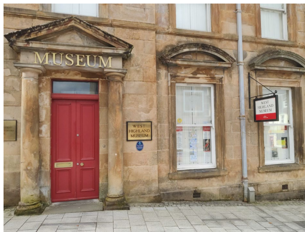
Imagen 4. Acceso principal al West Highland Museum, Fort William