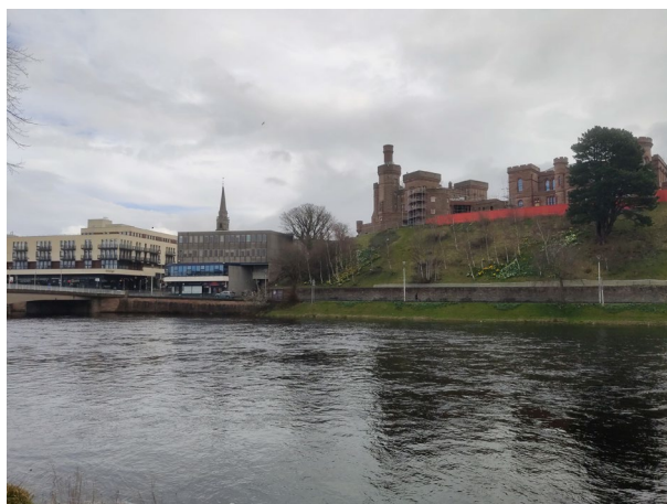
Imagen 3. Perspectiva del río Ness, Castle Wynd y el Inverness Museum and Art Gallery, Inverness.

del museo, haciendo las veces de nexo de unión con la población local. El Inverness Museum and Art Gallery, a través de esta actuación, desarrolla un proceso de marketing sencillo, pero efectivo.