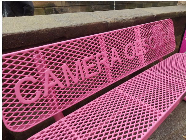
Imagen 2. Detalle Camera Obscura & World of Illusion, Edimburgo.

absurdas curiosidades que atesora. Pero posee, lógicamente, su público nada objetivo, porque toda clientela vale, que de alguna u otra manera sale encantado. Al igual que lo hace su cuenta de resultados.