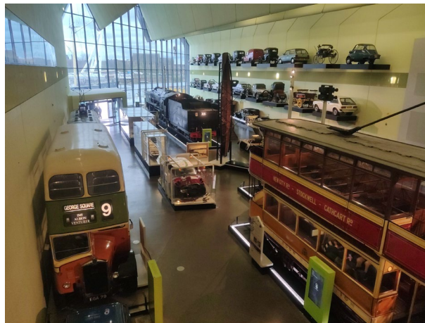
Imagen 7. Espacio expositivo interior del Riverside Museum, Glasgow.

público objetivo, una vez más, vuelven a ser los menores. Pero en este caso se incide en el nicho que representan los niños con trastorno del espectro autista y sus familias. Específicamente para ellos se confeccionó el exitoso y reconocido programa Subway Sleuths ( https://www.nytransitmuseum.org/learn/subwaysleuths/ ), repleto de juegos y actividades didácticas. La institución neoyorquina, al igual que el Riverside Museum, se vale de un objeto cotidiano y reconocible como reclamo, siendo este un paraguas xerografiado. Los miembros de su staff , durante los días lluviosos, suelen portar tan significativo accesorio. Y lo hacen intencionadamente con el objeto de llamar la atención y atraer a los familiares de los niños con autismo, interesados en su reconocido programa educativo. Estos se acercan al personal del museo, a quienes reclaman información sobre lo que la institución puede hacer por ellos. Los usuarios del característico paraguas son fácilmente identificables, dado que este contempla un logotipo bien visible del museo. Así, un accesorio cotidiano carente de valor hace las veces de mercadotécnico faro en la noche. No se trata de una casualidad, sino de una campaña publicitaria intencionada basada en el indiscutible y magnífico reclamo que genera la actividad didáctica del museo, que queda refrendada sobre la tela de un objeto propio del merchandising .