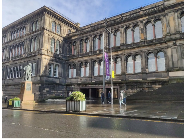
Imagen 9. Acceso principal al National Museum of Scotland, Edimburgo.

presta una atención singular mediante el desarrollo de actividades específicas. Enfoca, incluso con mayor interés, su atención sobre el reducido nicho que representan los alumnos extranjeros, generando un esfuerzo extra para procurar tanto su inclusión como su participación en las actividades y el disfrute del museo.