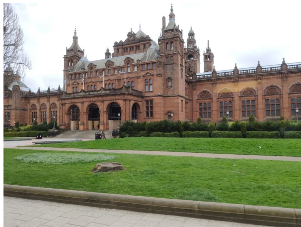
Imagen 1. Fachada principal del Kelvingrove Art Gallery and Museum, Glasgow.

El museo, en resumen, como organización y producto cultural está sobradamente capacitado para satisfacer las necesidades de sus públicos, siempre y cuando desarrolle correctamente el proceso anterior. Para ello se vale, principalmente, de la educación, tanto desde la perspectiva tradicional, recogida en su misión y objetivos, como apoyándose en un enfoque meramente estratégico. Si dicha institución opta por ejecutar la segunda opción, sin obviar en su totalidad a la primera, el museo podrá rediseñar y proyectar con mayor adecuación su capacidad comunicativa, identidad e imagen de marca. Todo parabienes. Las audiencias, de esa forma, estarán capacitadas para identificar con mayor facilidad los atributos museísticos, convirtiendo el proceso educativo-mercadotécnico en una evidente ventaja competitiva.