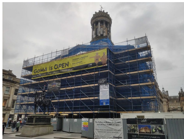
Imagen 5. Edificio de la Gallery of Modern Art (GoMA) y estatua ecuestre del duque de Wellington, Glasgow.

Superado Fort William la brújula indicó al suroeste, hacia las no menos bellas Tierras Bajas. Un camino que sumerge al visitante a través del fascinante paisaje y paisanaje que atesora Glen Coe, con parada obligatoria en el singular Glencoe Museum, para desembocar definitivamente en la bella ciudad de Stirling. Esta localidad, conocida como la «llave de Escocia» al ser el escenario principal de las guerras de independencia de los siglos XIII y XIV (Barrell, 2007, pp. 92-136), está repleta de atractivos culturales de ingente valor educativo, inserto en colecciones, exhibiciones y discursos expositivos. Entre ellos destacan conocidos recursos, como el National Wallace Monument (1869), el Stirling Smith Art Gallery and Museum o el fastuoso castillo (siglos XIV-XVI) local. Solo la falta de espacio impide explayarme con detenimiento sobre estas extraordinarias localizaciones garantes de gran interés.