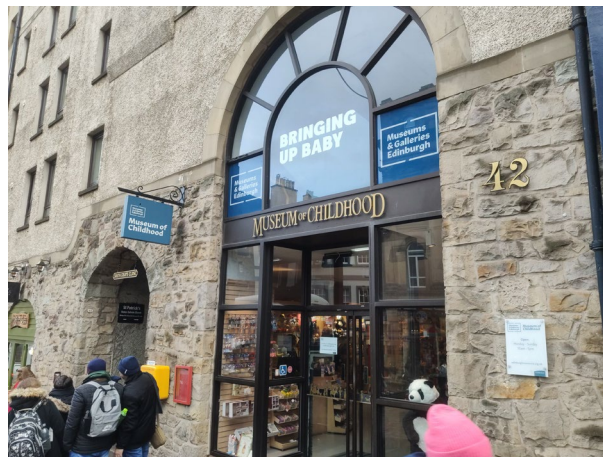
Imagen 8. Acceso principal al Museum of Childhood, Edimburgo.

de seducción o, lo que es lo mismo, de marketing . El menor, al discurrir por sus salas, se asombra mientras descubre las curiosidades propias de la metodología docente o los juguetes de otras épocas, durante una visita educativa y gratificante. El adulto, por otro lado, acaba encantado al regresar momentáneamente a un pasado añorado que revive, presenta y expone en primera persona a las generaciones más jóvenes. En conclusión, la estrategia didáctica desarrollada por el Museum of Childhood de Edimburgo se ampara en la melancolía. Esta emoción se define como un exitoso reclamo, que no deja de ser otra táctica de marketing con una descomunal capacidad para la atracción de visitantes.