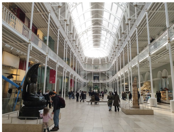
Imagen 10. Panorámica de la Grand Gallery del National Museum of Scotland, Edimburgo.

La organización se vale, respecto al segmento familiar, de un interesante recurso didáctico denominado Family Galleries . Estas son espacios repletos de elementos interactivos y zonas específicas para la experimentación de pequeños y mayores, disponiendo, incluso, de actividades concretas para el entretenimiento y aprendizaje de los bebés. Bajo la denominación de Imagene y Adventure Planet estas galerías familiares permiten que, además de jugar con sonidos e incluso disfrazarse, las familias en su conjunto pueden explorar las maravillas del mundo natural, desarrollar actividades con el objeto de proteger el planeta, sumergirse en las profundidades del mar o emular la labor de los paleontólogos al descubrir restos de dinosaurios ( https://www.nms.ac.uk/national-museum-of-scotland/families ).