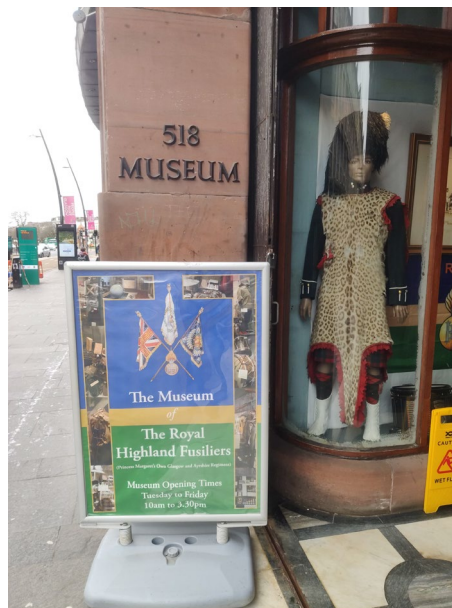
Imagen 11. Detalle acceso al Royal Highland Fusiliers Museum, Glasgow.