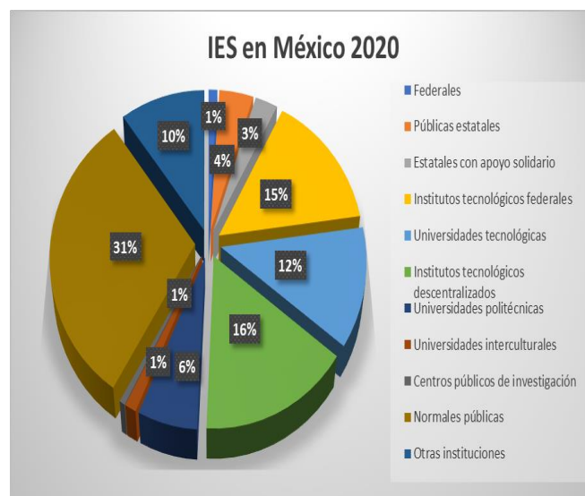
Figura 1. Cantidad de universidades públicas en México.

Para 2020 se contabilizan 837 universidades públicas en México: 9 federales; 35 públicas estatales; 23 estatales con apoyo solidario; 126 institutos tecnológicos federales; 104 tecnológicas; 130 institutos tecnológicos descentralizados; 51 politécnicas; 10 interculturales; 5 centros públicos de investigación; 261 normales públicas y otras 87 instituciones públicas (SEP, 2020b) (Ver figura 1).