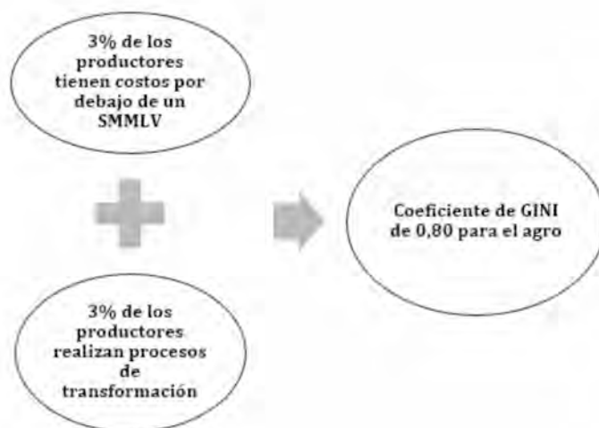
Figura 2. Producción y Transformación en el sector primario