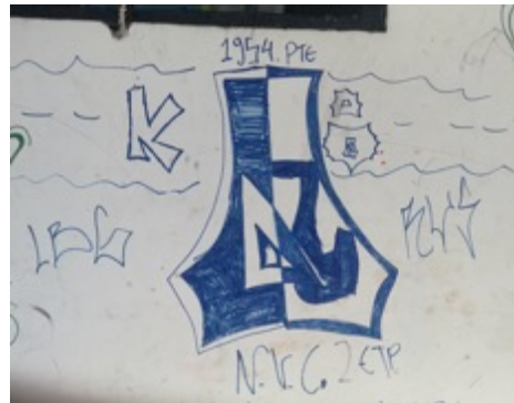
Figura 1. Símil de escudo equipo de futbol Deportes Tolima.

conductas disruptivas de la norma producto del fenómeno barrista