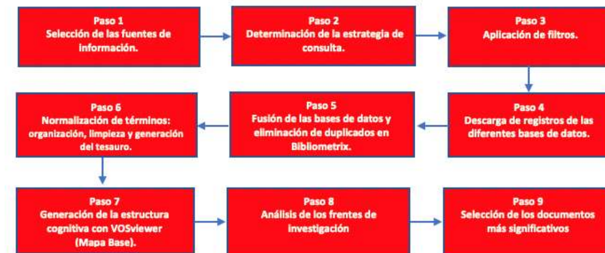
Figura 1. Esquema metodológico