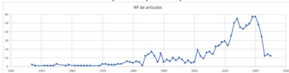
Figura 1 Gráfica de la evolución de las publicaciones sobre La casa de Bernarda Alba por año de publicación (1947–2025).